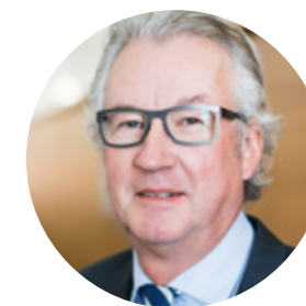
Eduard Fischer Offsetdruckerei Schwarzach